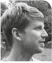
FREE CLAERBOUT INSECTENWERKGROEP ZUID-WEST-VLAANDEREN